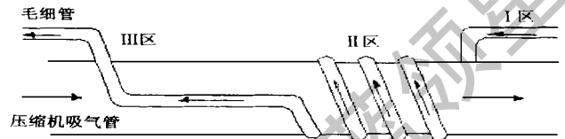
图1 毛细管传热图示

图1为简化的毛细管物理形态,在整个的流动过程中,由于环境空气和制冷剂传热量对整个流动过程影响很小,故忽略和空气的自然对流传热。流动过程分为三个区域: I 区为绝热单相流动; II 区为有回热的两相流动,此时毛细管和压缩机回气管有回热; III区为绝热的两相流动。