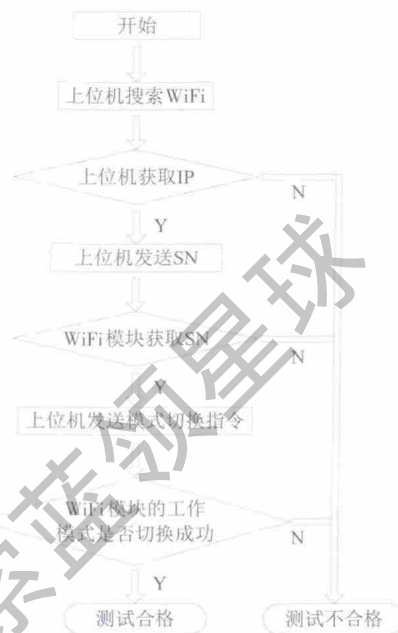
图5 上位机软件流程图