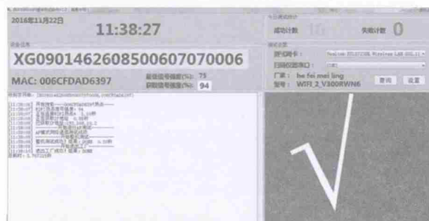
图 3 用户界面窗口