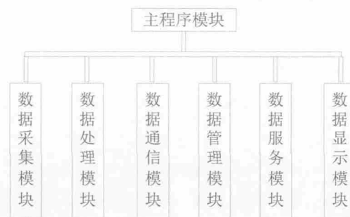
图 2 上位机软件结构图

引入数据库的数据检索技术,在测试历史日志里可以查看检测数据,包括:检测时间、SN 及 MAC 信息、软件版本、信号强度、失败代码、检测耗时。数据查询方式灵活,既能以某个要素定向搜索,还支持按照测试结果进行过滤查询,亦可通过多个要素的随机组合查看检测数据 [2] 。如图 4 所示。