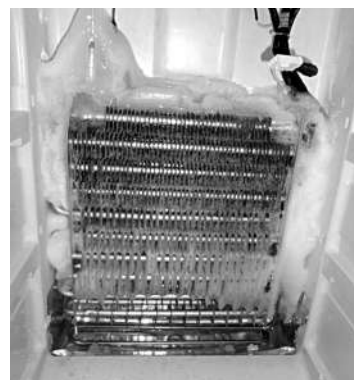
图3 接通加热器后第二次化霜效果