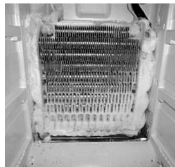
图2 接通加热器前蒸发器上结霜情况

测试过程中，化霜效果如图 2 和图 3 所示。图 2 为接通加热器前蒸发器上的结霜情况，从图中可以看出，蒸发器表面、两侧及其连接管上都结满了大量的霜，这对化霜系统来说是个沉重任务。图 3 为接通加热器后第二次化霜结束的情况，从图中可以看出，在第二次化霜后，蒸发器两侧仍残留了大量的霜，蒸发器表面也有部分霜没化干净。