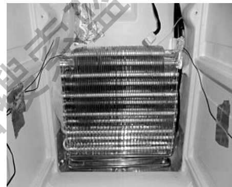
图4 改进后的第二次化霜效果

改善化霜的方案常见有两种: 一是提高化霜加热器的功率, 二是延长化霜时间, 必要时可同时实施两种方案。针对以上实验结论, 将化霜方案进行改进, 改进前后化霜系统方案的区别如表1所示: