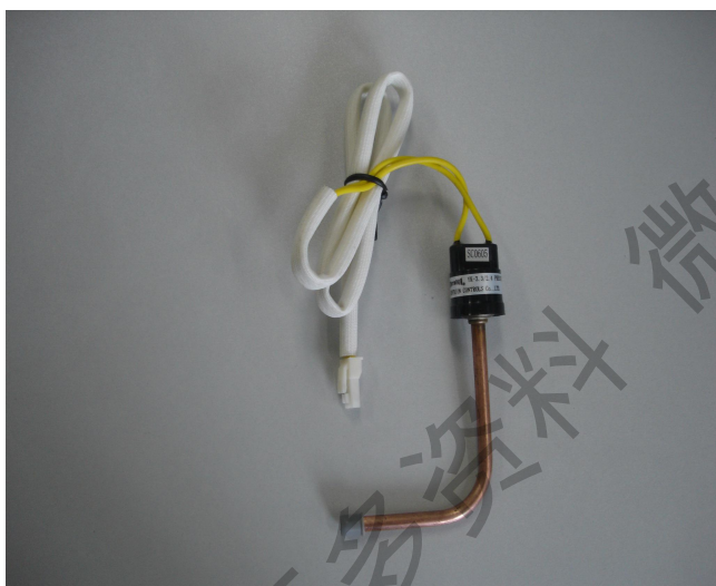
图三 高压压力控制器

请注意！该器件内部开关处在常闭状态，单体测试和在路测试其电阻值为零。若电阻为无穷大，说明器件已坏。为了防止意外，维修时禁止短接该器件。