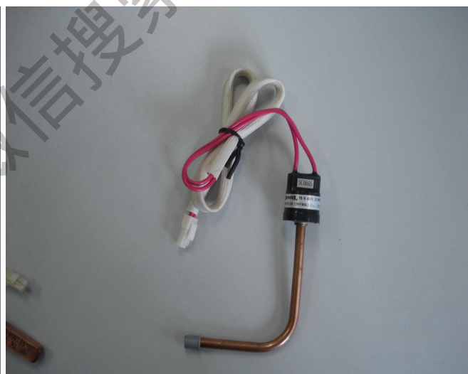
图四 低压压力控制器