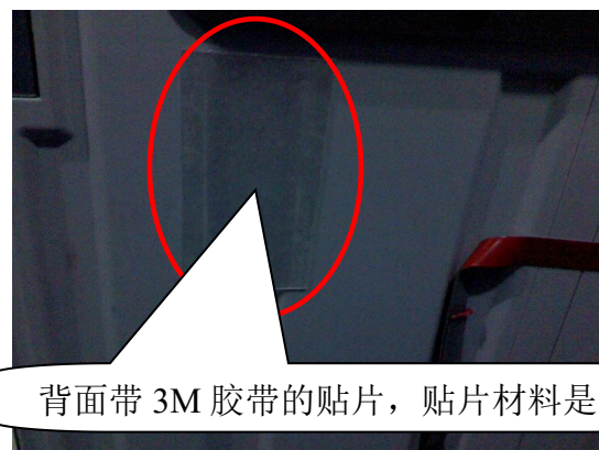
背面带 3M 胶带的贴片，贴片材料是 PC