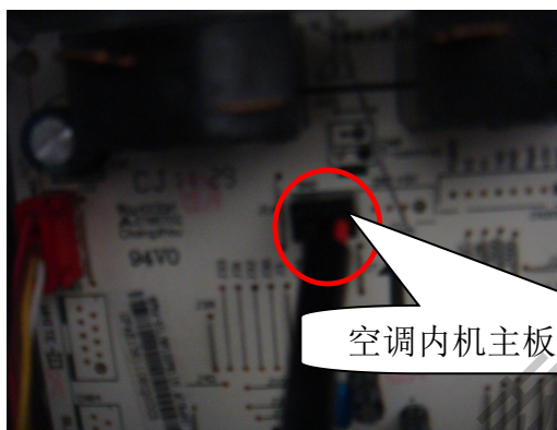
空调内机主板格栅保护插子位置（黑色）

(2) 若用手按住格栅按键保护开关，故障仍不消失；则需要将格栅保护开关插子从室内电控板上拔下，用手按住开关后用万用表检测格栅保护开关插子位置是否处于短路状态，若开关为短路，则说明室内电控存在故障，需更换处理；或者直接将主板位置格栅保护插子进行短接，若短接后空调故障仍不消失，则说明室内电控主板故障，需对应更换处理；