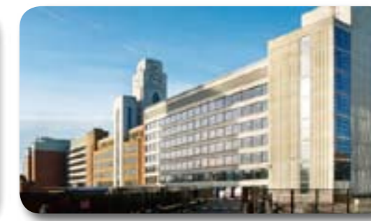
MITIE Infrastructure Ltd(英国)