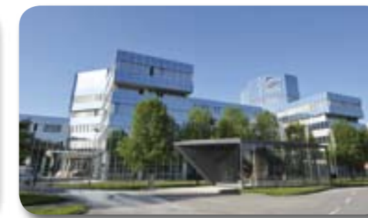
MTU Aero Engines(波兰)