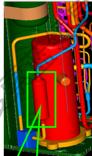
更改后消声器位置