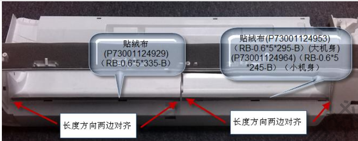
图 7 (此处两绒布尺寸为 0.3*5*335、0.3*5*245)