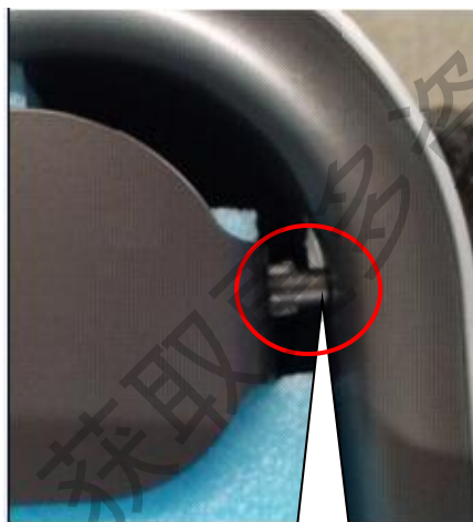
横格栅脱出轴套外。

2、如拆开后发现横格栅脱出白色轴套以外，则需将横格栅防护包装棉去掉，然后用一只手顶住脱出的一端，另一只手轻微弯曲横格栅中部，最后将横格栅脱出的一端装进轴套中即可。