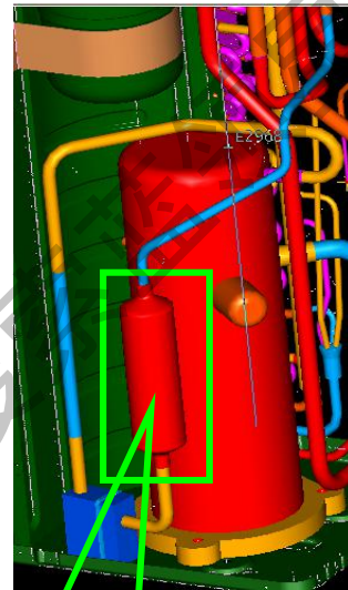
更改后消声器位置