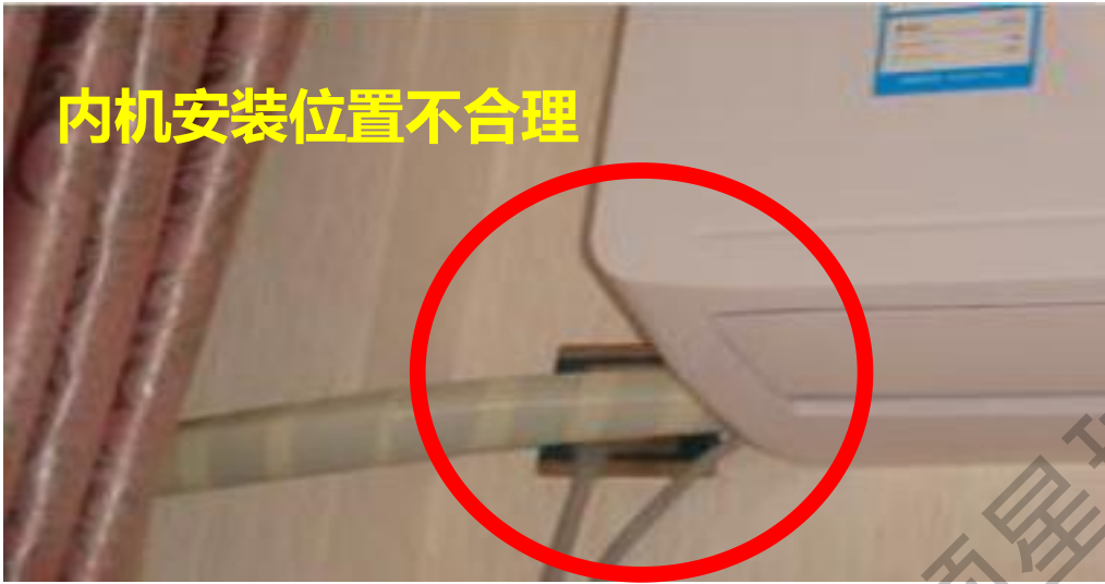
内机安装位置不合理