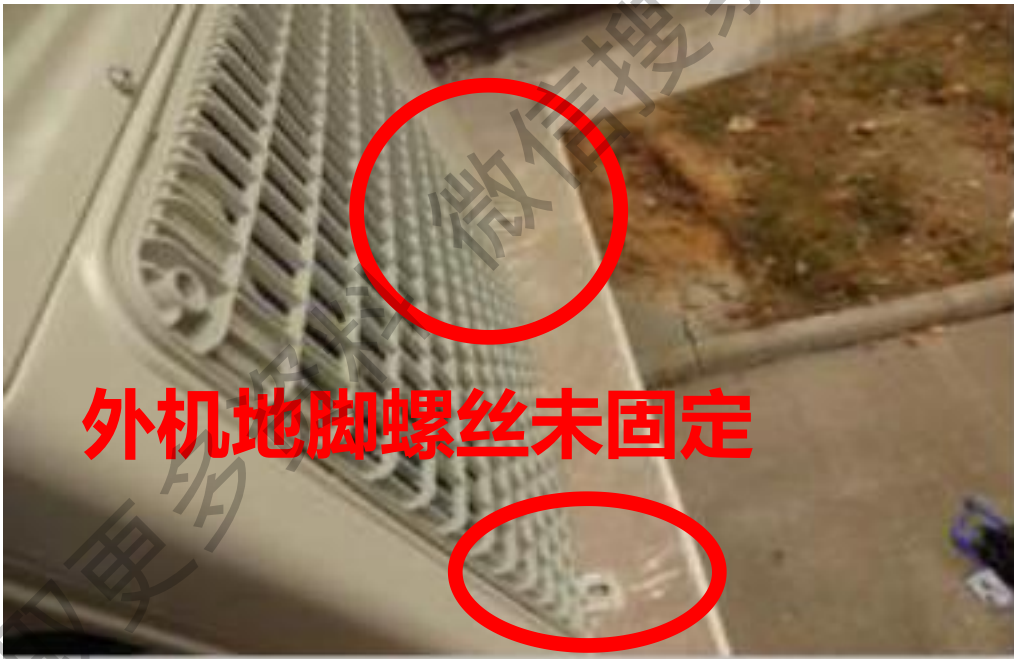
外机地脚螺丝未固定