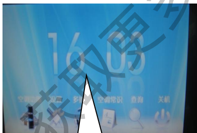
空调控制操作界面