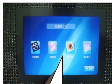
空调多媒体功能操作界面