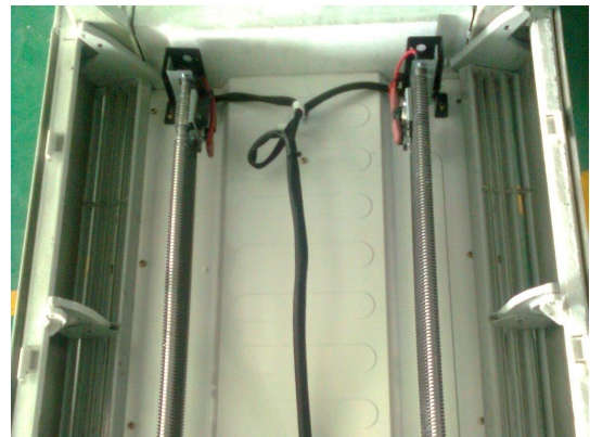
更改后PTC固定在出风盖板上