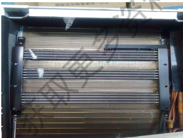
更改前PTC固定在蒸发器边板上