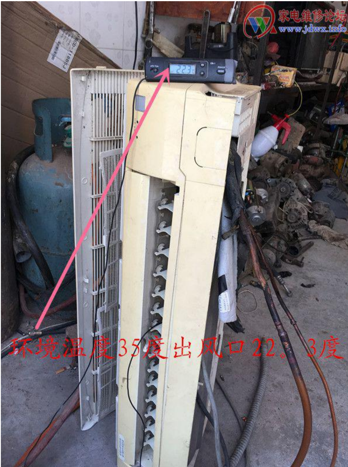
12 副本.jpg (102.07 KB, 下载次数: 0)