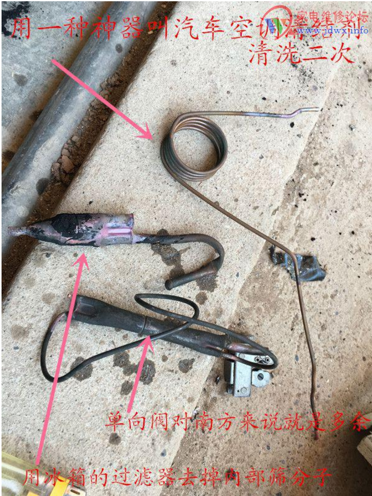
8_副本.jpg (134.17 KB, 下载次数: 0)