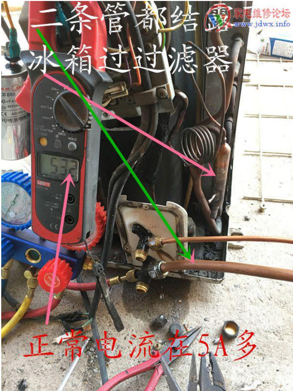
9 副本.jpg (115.73 KB, 下载次数: 0)