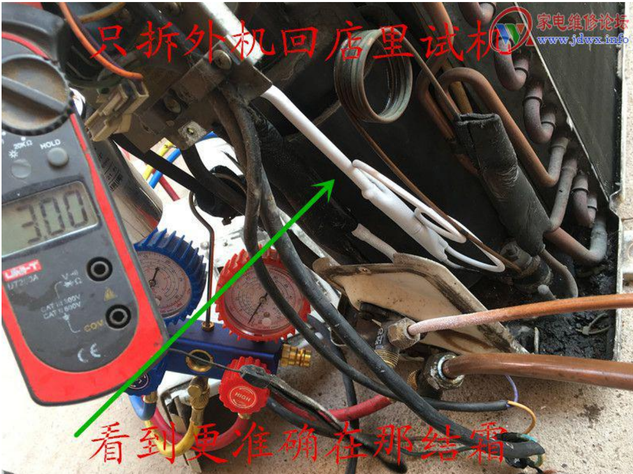
6 副本.jpg (101.71 KB, 下载次数: 0)