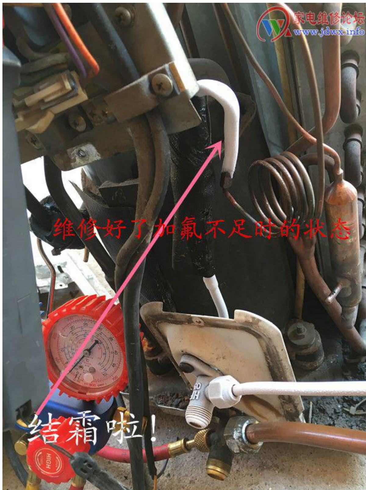
7 副本.jpg (155.37 KB, 下载次数: 0)